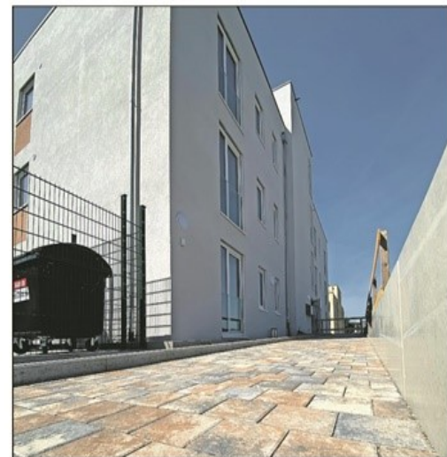
Durch eine gemeinsame Planung und Realisierung der beiden Häuser konnten Kosten gespart werden.

Die beiden Gebäude sind in Anlehnung an die Umgebungsbebauung mit drei Vollgeschossen und einem zurückgesetzten Dachgeschoss gebaut worden. Insgesamt sind in beiden Gebäuden zusammen 28 Wohneinheiten entstanden. Die Gebäude wurden in Massivbauweise ohne Verwendung eines Wärmedämmverbundsystems