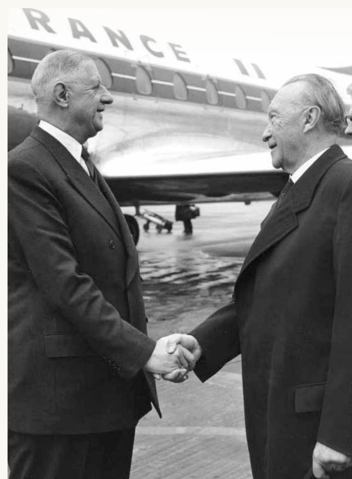
Staatsbesuch. Adenauer begrüßt de Gaulle am Flughafen Köln/Bonn, 1962