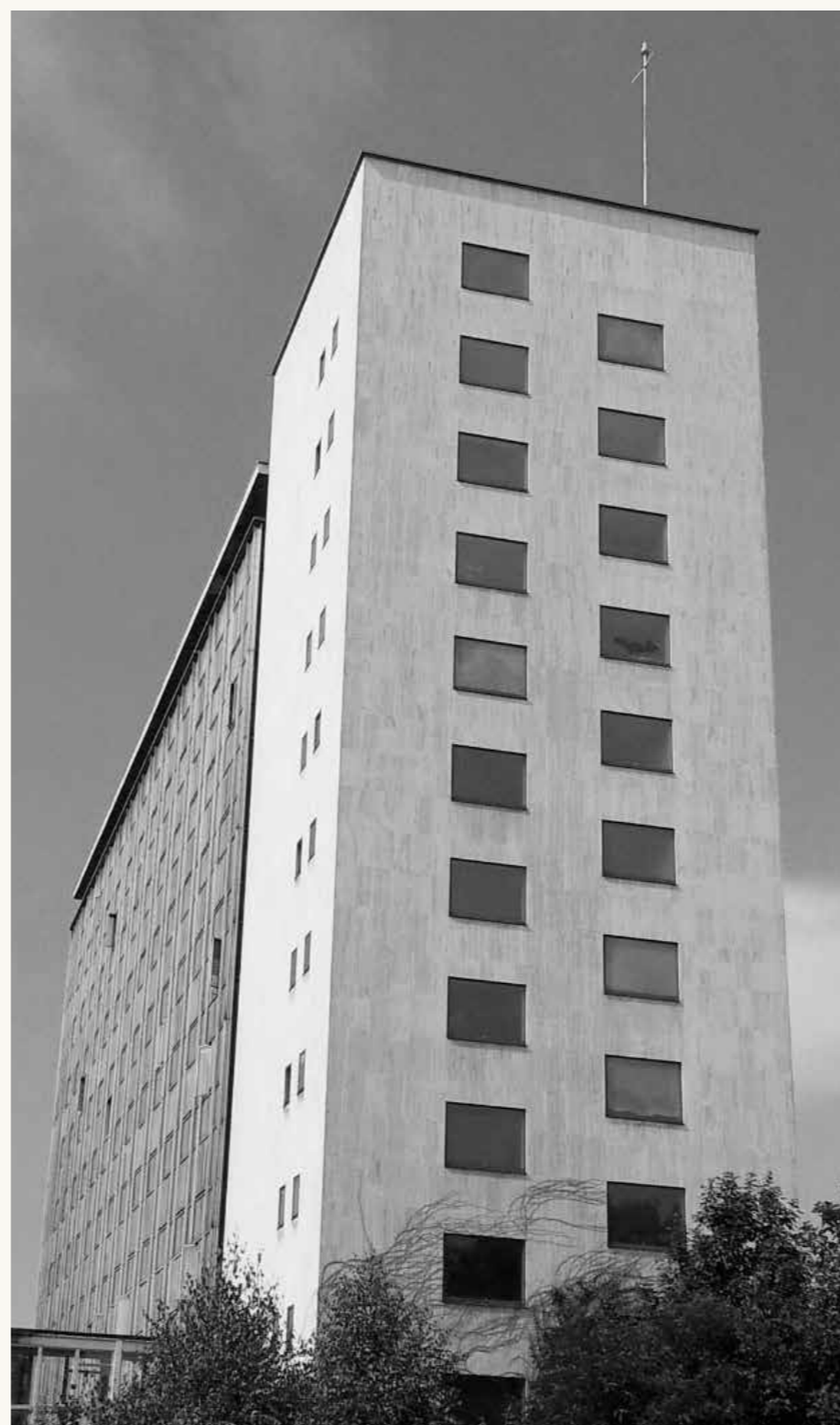
L'édifice « BABO », 2012

L'ex-Bâtiment Administratif de Baden Oos de 1954, communément connu par l'abréviation « BABO », est l'œuvre de l'architecte Karl Kohlbecker. Construit en seulement onze mois, il est utilisé par les forces françaises jusqu'à leur départ en 1999. Du point de vue constructif, l'emploi d'une ossature métallique et d'un mur-rideau composé d'éléments préfabriqués le placent parmi les bâtiments les plus innovateurs de l'après-guerre en Allemagne.