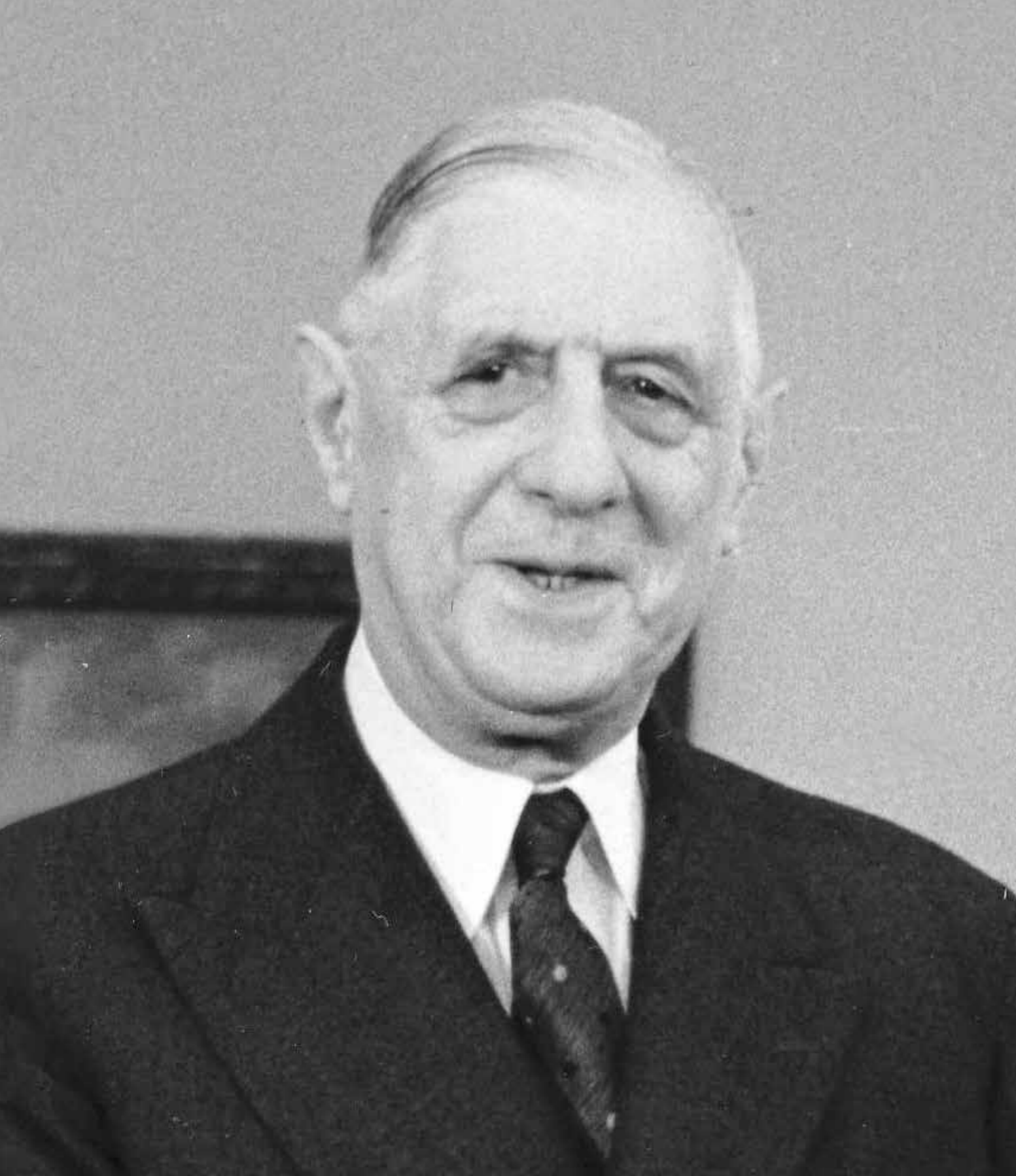
Charles de Gaulle, 1963