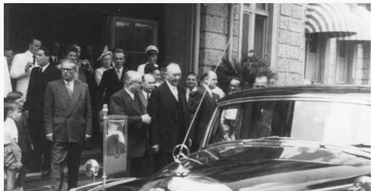
Konrad Adenauer empfängt Charles de Gaulle vor Brenners-Park-Hotel, 1962

Am 15. Februar 1962 trafen sich beide Staatsmänner zusammen mit den jeweiligen Außenministern, Staatssekretären und Botschaftern in Brenners Park-Hotel. Das in diesem Rahmen besprochene Thema – die sowohl von de Gaulle als auch Adenauer geteilte Sorge um die Freiheit Europas – darf als einer der Eckpfeiler der deutsch-französischen Aussöhnung sowie der Europäischen Idee betrachtet werden.