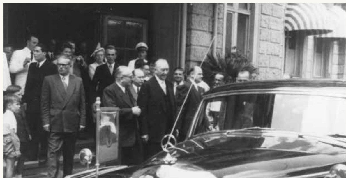
Konrad Adenauer accueille Charles de Gaulle à l'entrée du Brenners Park-Hotel, 1962.

Le 15 février 1962, le Général de Gaulle et le Chancelier Adenauer, rejoints par leurs ministres des Affaires étrangères, secrétaires d'État et ambassadeurs respectifs, se rencontrent au Brenners Park-Hotel pour aborder un souci commun, celui de la liberté de l'Europe. Les échanges de cette journée sont considérés comme l'une des pierres angulaires de la réconciliation franco-allemande et du projet européen.