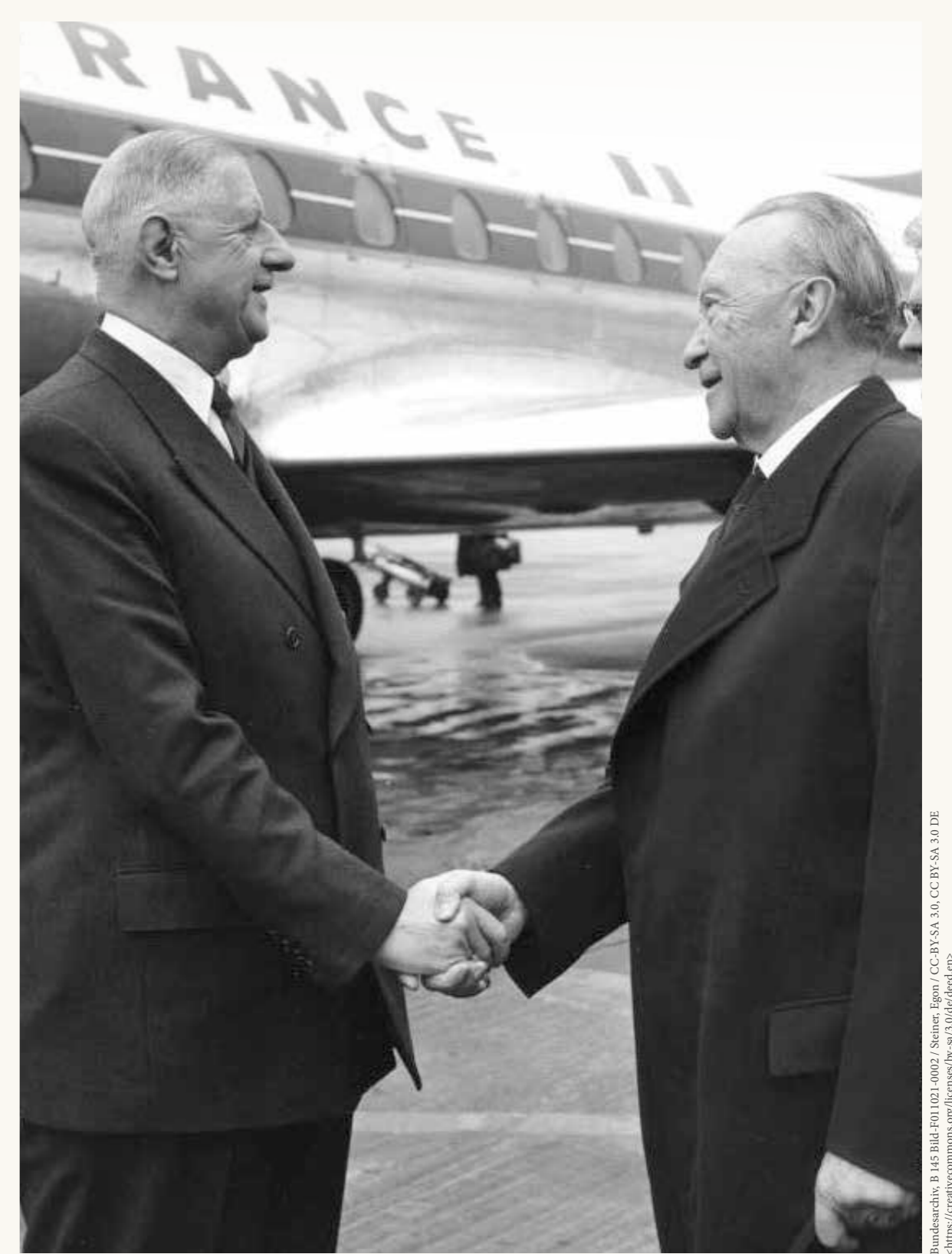
Visite d'État. Le chancelier Adenauer salue le Général de Gaulle à l'aéroport de Cologne/Bonn, 1962